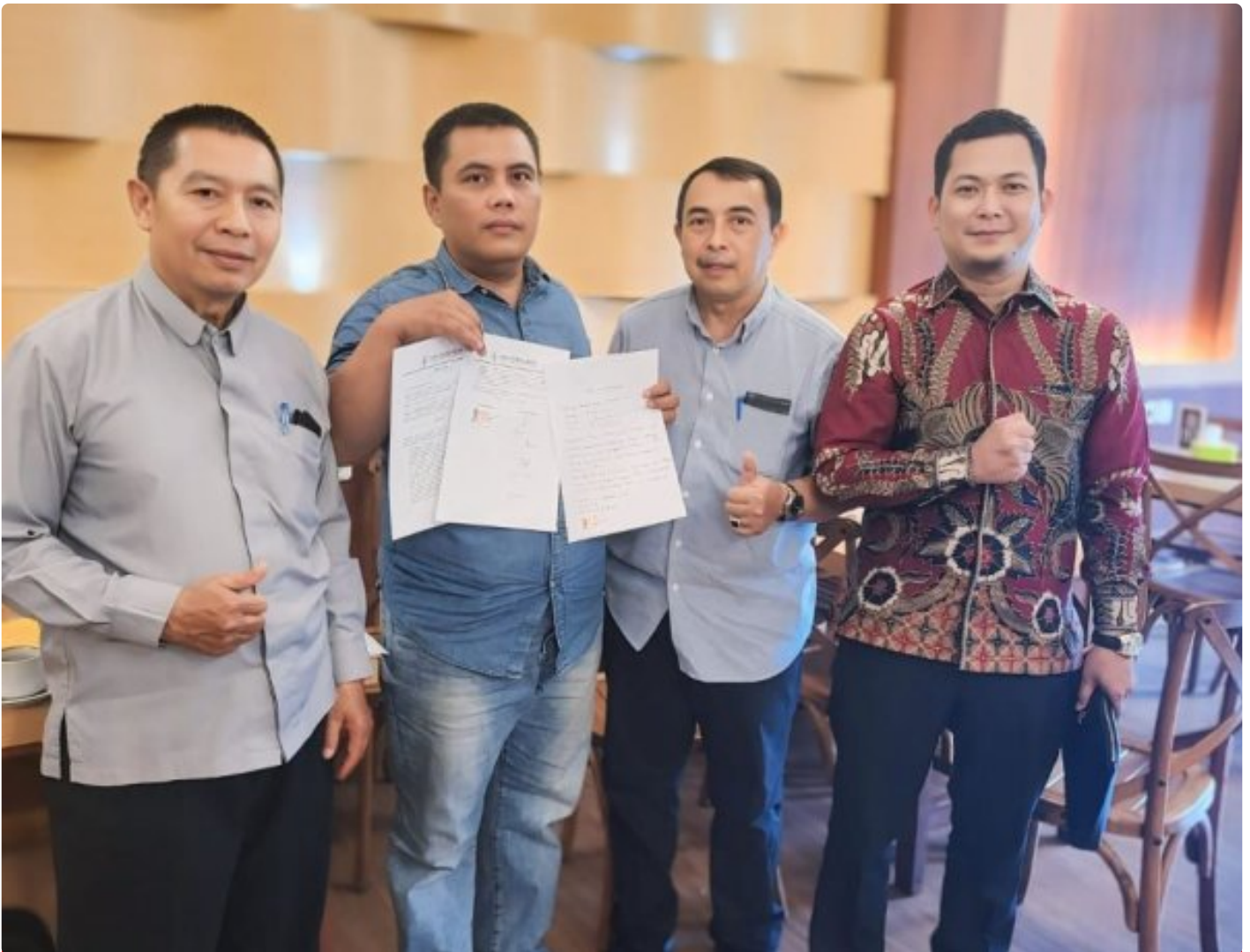
Kuasa Hukum Ningto Wahyu Dens & Partners Lawfirm di perkara Dugaan Pemalsuan Data dan Kredit Fiktif di Bank BRI Unit Kalideres.

JAKARTA, JNI - Seorang bekas nasabah Bank BRI, yang dikenal dengan inisial NW, melaporkan dugaan pemalsuan data dan kredit fiktif yang melibatkan oknum pegawai Bank BRI Unit Kalideres.